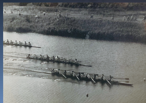
昭和36年の全日本選手権の様子